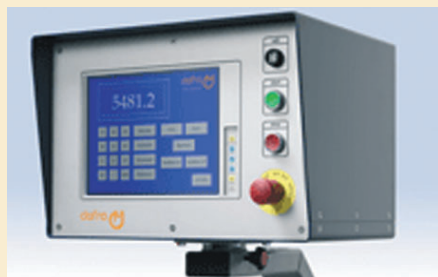
Bedieningspaneel met touch screen

Daarnaast levert Dofra bewerkingsstraten (boorstraten, ponsstraten, zaagstraten, ) waarin lengtemeetsysteem en bewerkingsmachine reeds voor u zijn geïntegreerd. Met de boorstraat wordt tijdrovend en arbeidsintensief werk een peulschil. Meten, aftekenen, centreren en gaten voorboren behoort dank zij de Dofra boorstraat tot het verleden. Met behulp van de Dofra zaagstraat zaagt u snel, nauwkeurig en zonder onnodige materiaalverliezen.