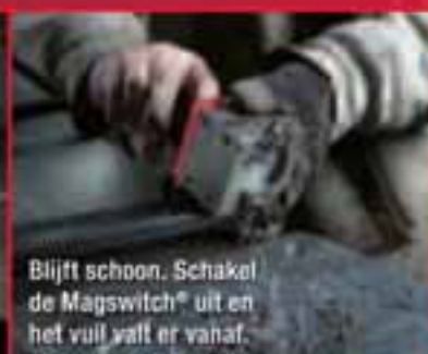
Blijft schoon. Schakel de Magswitch® uit en het vuil valt er vanaf.