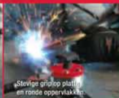
Stevige grip op platte en ronde oppervlakken.