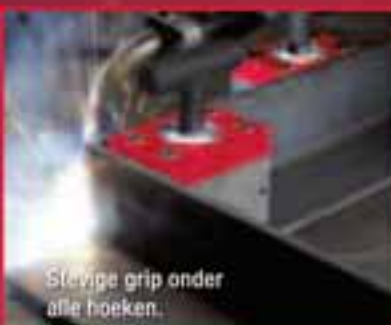
Stevige grip onder alle hoeken.