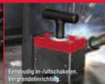
Eenvoudig in-/uitschakelen. Vergrendelinrichting.